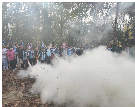
汉阴县月河初级中学实习生参与消防应急疏散演练