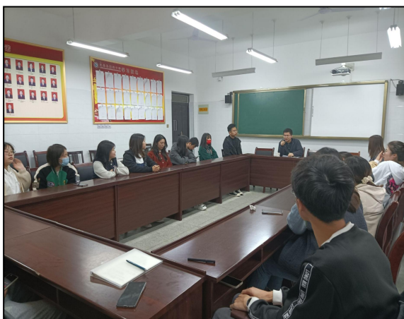
岚皋县城关初级中学带队教师与实习生座谈