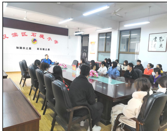
汉滨区石堤小学带队教师与实习生座谈