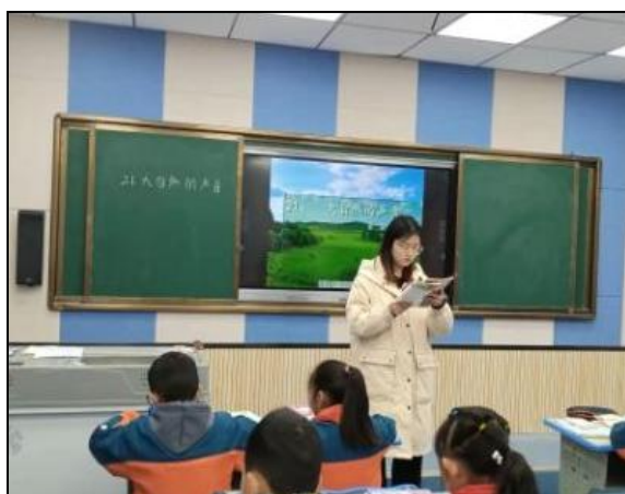
汉滨区鼓楼小学实习生在上中期汇报课