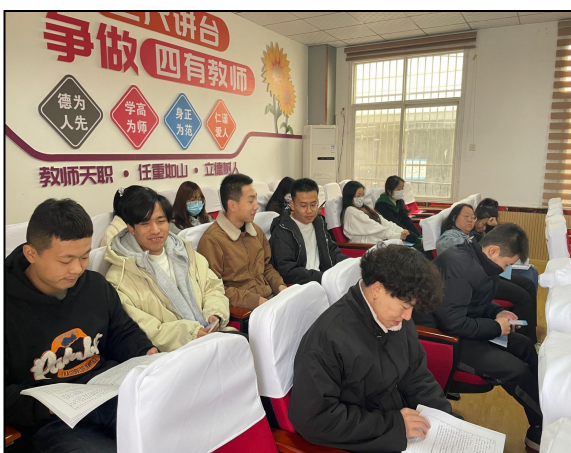
汉阴县蒲溪初级中学带队教师检查实习生备课情况