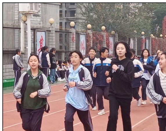
江北高级中学实习生和学生一起跑步