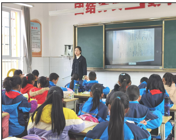
恒口示范区梅子铺九年制学校实习生在讲课