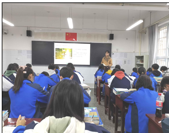
汉滨初级中学实习生正在指导讲课