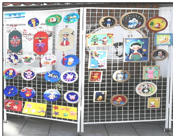
江南小学实习生指导学生制作的手工作品