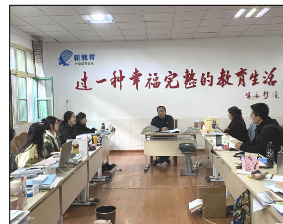
大同初级中学带队教师与实习生座谈