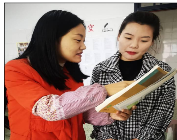
安康市初级中学指导老师帮助实习生课后反思