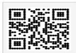
图1 新教务系统登录入口