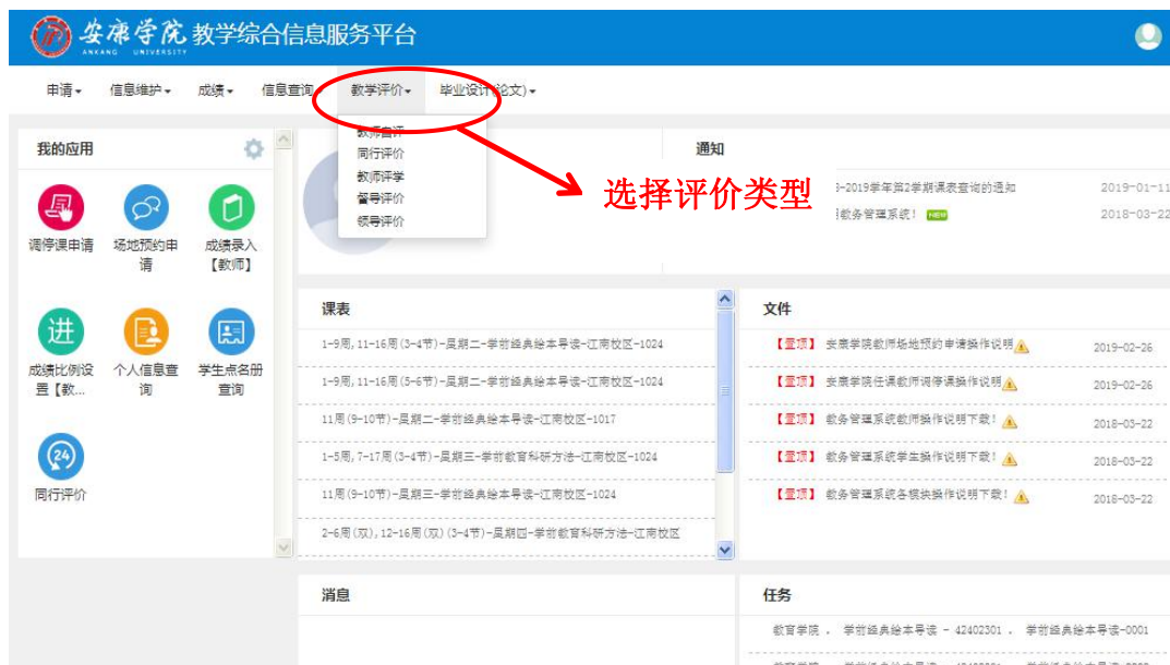
图 3 网上评价界面

教师进入自己的信息系统之后，点击【教学评价】后可选择【同行评价】、【教师评学】、【督导评价】，如图 3 所示。