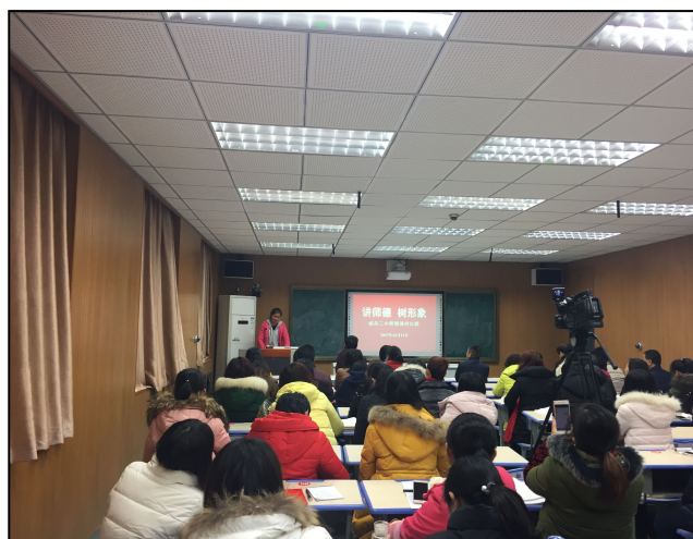
平利县城关二小实习生参加师德演讲比赛