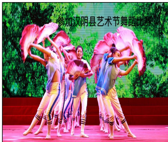
汉阴县月河中学实习生参加舞蹈比赛