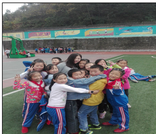
岚皋县民主小学实习生与学生做游戏