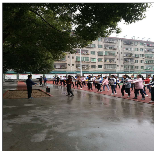
汉阴县初级中学实习生正在上体育课