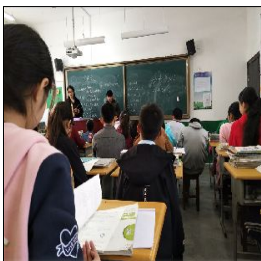
岚皋县民主初级中学实习生讲课