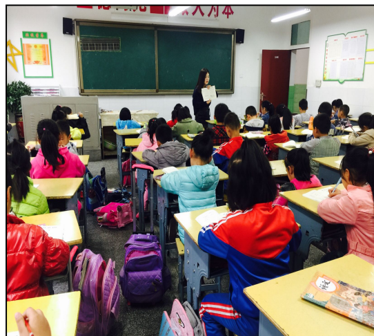
岚皋县民主小学实习生给学生上课