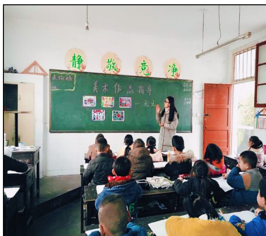
汉滨区民主九年制学校实习生参加美术展指导