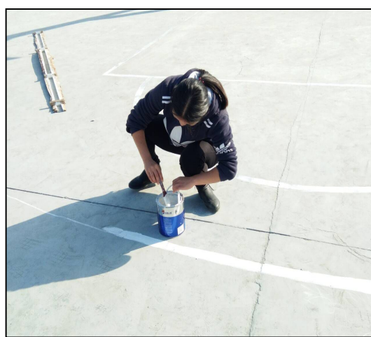
迎风九年制实习生为学校规划篮球场边线