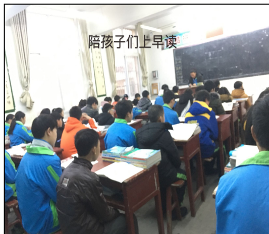
汉阴县月河中学实习生组织早读