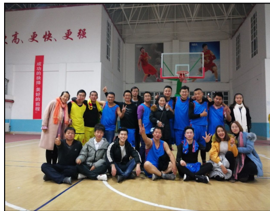
新疆伊犁巩留第二中学实习生参加教职工篮球