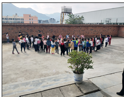
五里民主九年制学校实习生组织学生排练节目