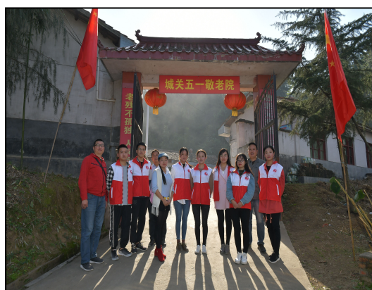
月河中学实习生参加敬老院活动