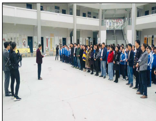
汉滨初中实习生参加艺术节开幕式