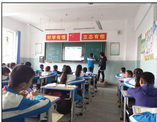
新疆伊犁巩留阿孜尔森镇中心小学实习生在上课