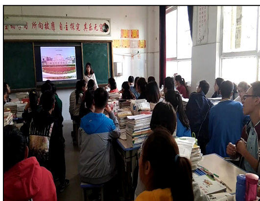
江北高级中学实习生在上课