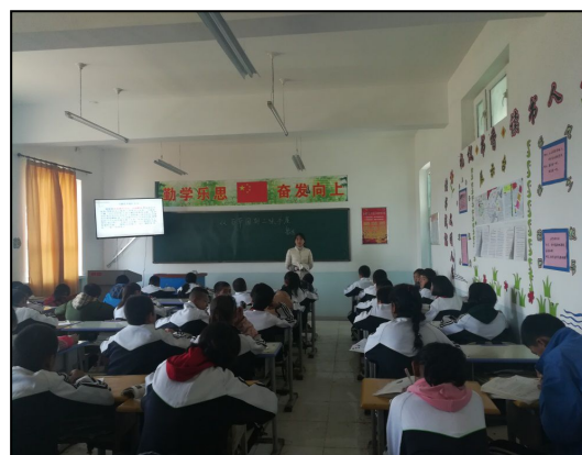
新疆伊犁巩留提克阿热克镇中学实习生在上课