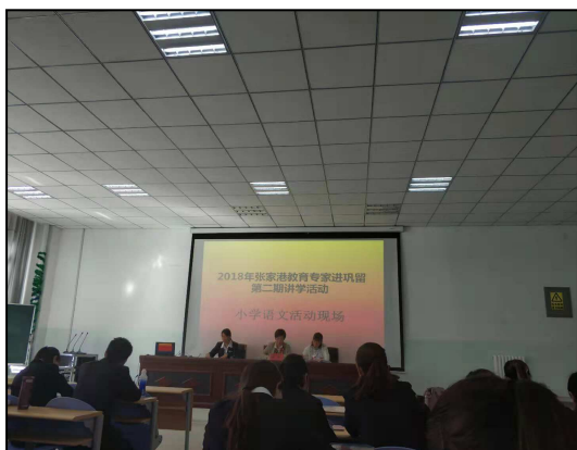
新疆伊犁巩留第一小学实习生参加教研活动