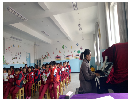
新疆伊犁巩留第二小学实习生在上音乐课