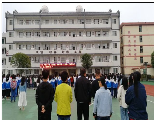
流水中学实习生与学生一起进行经典诵读