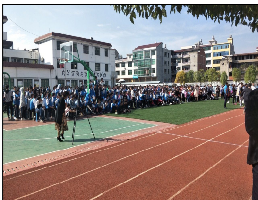
大同初级中学实习生组织学生参加运动会