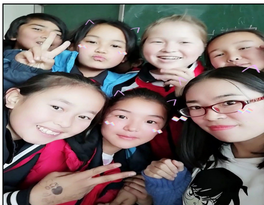
新疆伊犁巩留库尔德宁镇中学实习生与学生的快乐瞬间